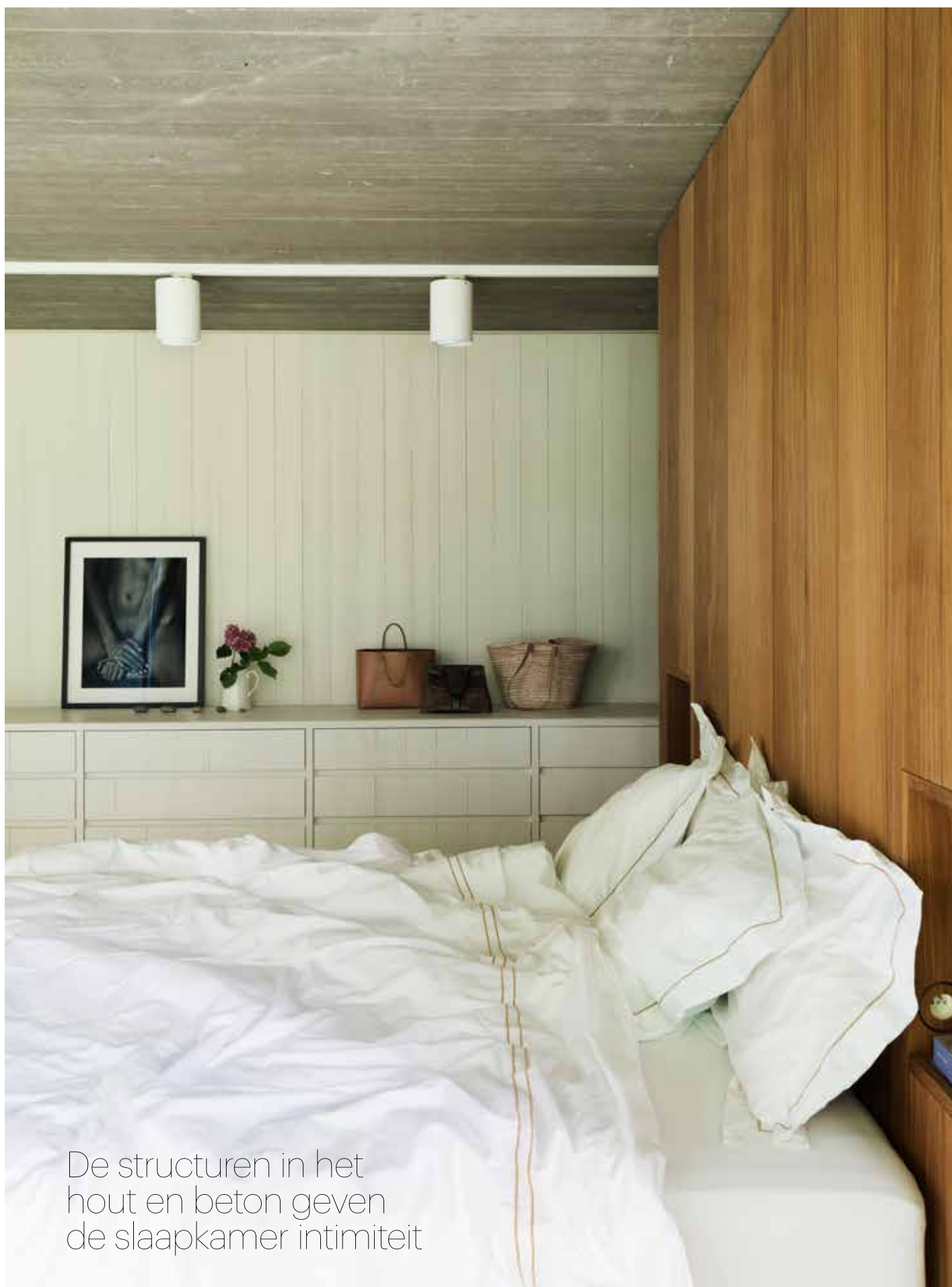
De structuren in het hout en beton geven de slaapkamer intimiteit